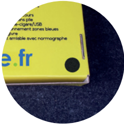
4 pastilles velcro

La Drivecase «Jeunes Conducteurs» est conçue pour les automobilistes qui viennent d'acheter leur première voiture. Celles-ci ne sont pas toujours équipées du matériel de sécurité obligatoire (Triangle et Gilet) et c'est pourquoi nous y avons ajouté un Triangle et un disque A magnétique. Tout comme sur les autres gammes, retrouvez les numéros d'urgence sur la face avant de la mallette, ainsi que des emplacements vides pour y noter votre groupe sanguin, vos allergies et le numéro de la personne à contacter en cas d'accident.