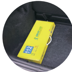
Facile à ranger