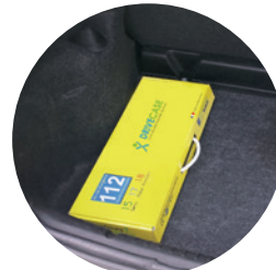
Facile à ranger