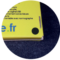
4 pastilles velcro

Tout comme sur les autres gammes, retrouvez les numéros d'urgence sur la face avant de la mallette, ainsi que des emplacements vides pour y noter votre groupe sanguin, vos allergies et le numéro de la personne à contacter en cas d'accident.